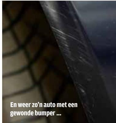
En weer zo'n auto met een gewonde bumper ...

De temperatuur loopt snel op en daardoor kan de lak gaan smelten." De plek wordt nogmaals met wat lak ingesmeerd en daarna wederom gepolijst. Het resultaat: de witte plekken zijn weg, de beschadiging is nog vaag te zien. Marcel: "Dat klopt. Van dichtbij zul je de krassen nog zien, maar monteer je deze bumper weer op de auto en sta je op normale afstand, dan is de plek nagenoeg onzichtbaar. Maar inderdaad, de littekens blijven, dat is waar. Bovendien zullen krassen op liggende delen, zoals de motorkap, beter zichtbaar blijven. Maar met SSR ben je sowieso stukken goedkoper uit dan met schuren, plamuren en spuiten." ■