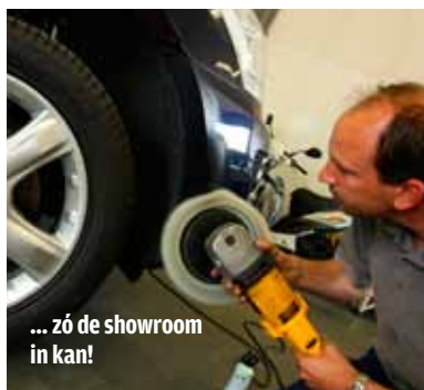
... zó de showroom in kan!