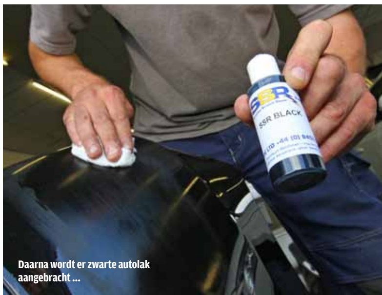
Daarna wordt er zwarte autolak aangebracht ...