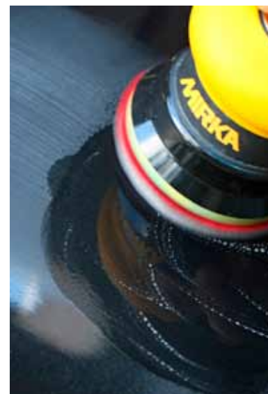
Na het schoonmaken wordt er gepolijst met een niet al te ruwe schuurpad en een beetje water.