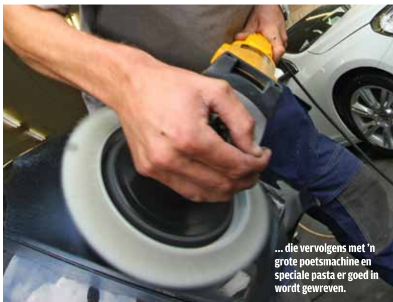
... die vervolgens met 'n grote poetsmachine en speciale pasta er goed in wordt gewreven.